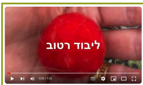
סרטון ליבוד רטוב-ענבל רוטברד